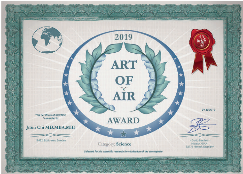
Der Airnergy-„Art of Air“-Award wurde 2019 Dr. Jibin Chi verliehen.

Da Sauerstoff ein paramagnetisches Teilchen ist, führt das schwächer werdende elektromagnetische Feld der Erde dazu, dass weniger Sauerstoff in der Atmosphäre und in den Ozeanen vorhanden ist. Außerdem löst ein erhöhter Schadstoffgehalt mehr unerwünschte chemische Reaktionen aus, die Sauerstoff verbrauchen und mehr gesundheitsschädliche Stoffe in der Luft erzeugen. Das Wassermolekül oder die Luftfeuchtigkeit sind gleichermaßen betroffen und können durch die Aufnahme weiterer Schadstoffe saurer werden.