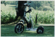
Ewo Life 26