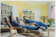
Tomatis Institut 40