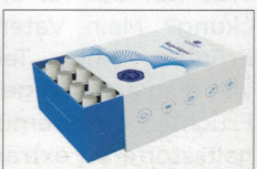
Dr. Niedermeyer Pharma 16