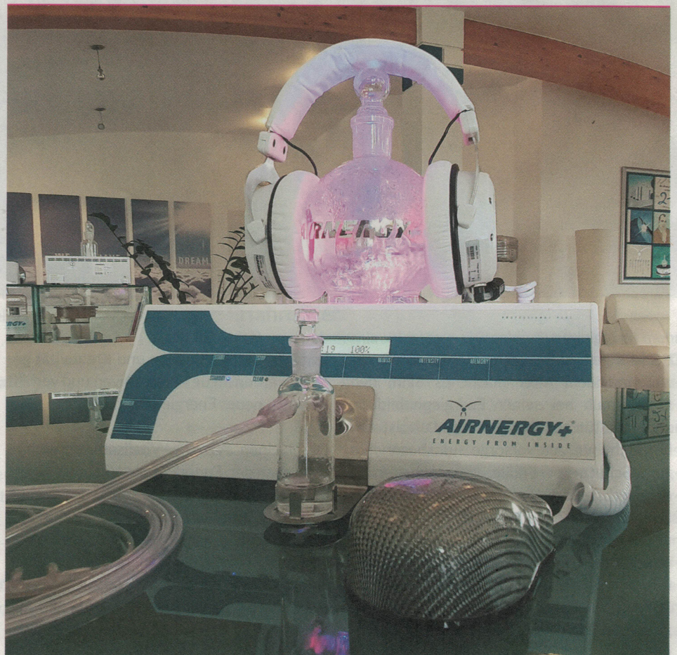
Bestens vitalisiert: mit dem Airnergy-Professional-Plus für die Energie von innen sowie mit Stream und Stream HS für die Energie von außen.