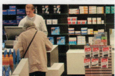
St. Johannis Apotheke 14