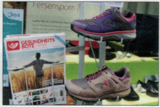
Foot Solutions 22