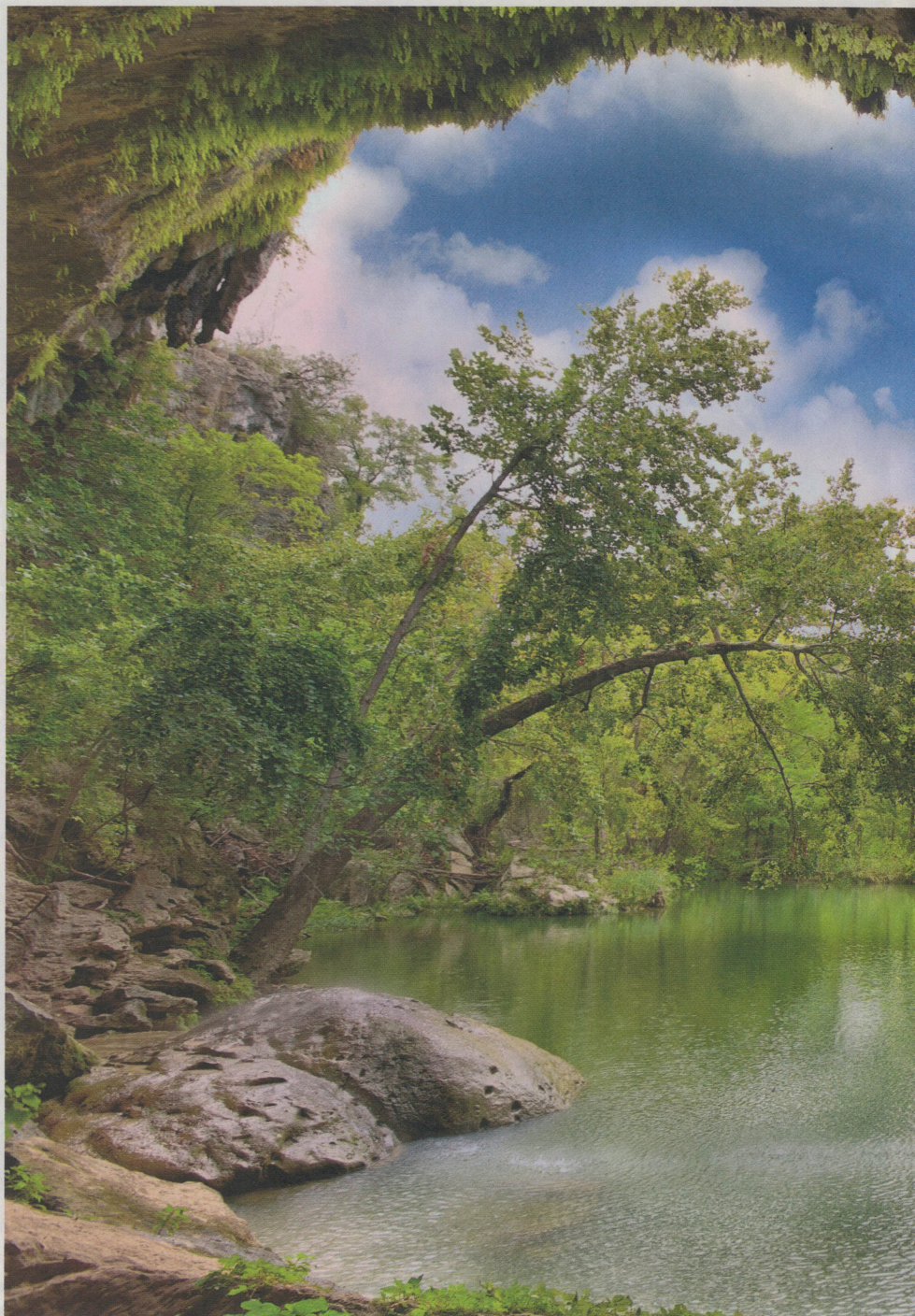
Die Airnergy-Vitalisatoren arbeiten ganz nach dem Vorbild der Natur und schaffen kleine Wohlfühlöasen.

Die frisch aufbereitete Luftatmosphäre, die mit Hilfe einer leichten, bequemen Atembrille über einen Zeitraum von etwa 21 Minuten eingenommen wird (die dreimal wöchentliche oder die tägliche Anwendung hat sich über 20 Jahre bewährt), trägt somit dazu bei, allerlei Mangelerscheinungen des Körpers zu balancieren oder einem Energieabbau früh-