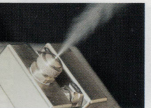
DESINFEK 3 50